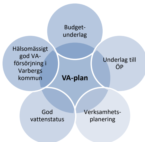
Figur 2. Strategisk VA-planering i Varbergs kommun har många olika nyttor, kopplade till miljön, till kommunens verksamhet och till invånarna.

För de delar i kommunens organisation som ansvarar för VA-planens åtgärder blir planen dessutom ett underlag för fortsatt verksamhetsplanering och budgetarbete. Åtgärder tydliggörs och tidsätts i VA-planen för att underlätta både den kortsiktiga och långsiktiga planeringen.