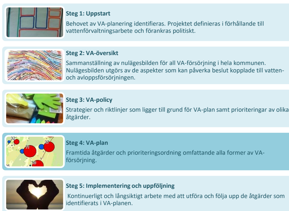
Figur 1: VA-planeringens fem steg.

Varbergs strategiska VA-planering baseras på de fem steg som rekommenderas i Havs- och vattenmyndighetens Vägledning för kommunal VA-planering 4 , se Figur 1. Vägledningen tydliggör VA-planeringens roll utifrån vattendirektivet och åtgärdsprogrammet för Västerhavet. Varbergs VA-plan omfattar dricks-, spill- och dagvatten både inom och utanför verksamhetsområdet för allmänt VA.