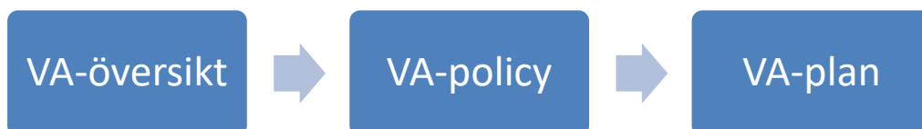
Figur 3. VA-planeringens tre huvuddokument.

Denna VA-plan är det tredje dokumentet som ingår i kommunens övergripande VA-planering 6 . De två tidigare dokumenten är VA-översikt och VA-policy , se Figur 3.