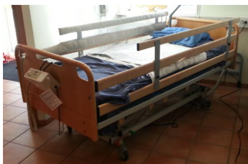
Comfort 2000 säng inkl. grindförhöjning