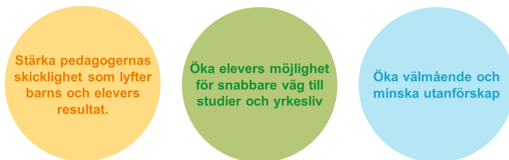
Bild 1. Barn- och utbildningsnämndens mål 2016-2019

Förskoleverksamheten är lagstyrd och ska utgå ifrån förskolans läroplan. Den är samtidigt politiskt styrd på kommunal nivå och ska uppfylla läroplan och höja kvaliteten i verksamheten genom ett arbete med de lokala politiska målen.