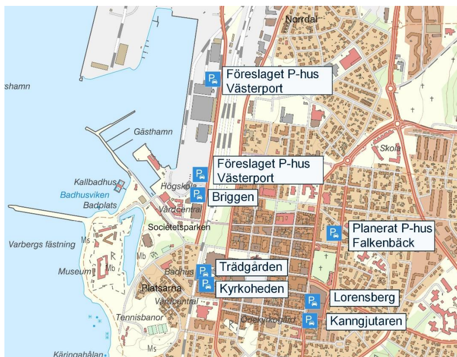
Figur 1 Alla parkeringshus, med undantag för det föreslagna p-huset i Västerport, ligger inom 500 meter från torget. Det gör att besökare har en närhet till målpunkter oavsett i vilket parkeringshus de väljer att parkera

I Varberg är det i dagsläget gratis att parkera med bil och parkeringstiden regleras med hjälp av tidsbegränsning och övervakningen sker med parkeringsskiva. Runt stadskärnan finns strategiskt utplacerade kommunala parkeringshus, Lorensberg (ca 470 platser), Kanngjutaren (ca 70 platser), Briggen (ca 290 platser), Kyrkoherden (ca 200 platser) och Trädgården (ca 230). Totalt har dagens parkeringshus över 1200 platser.