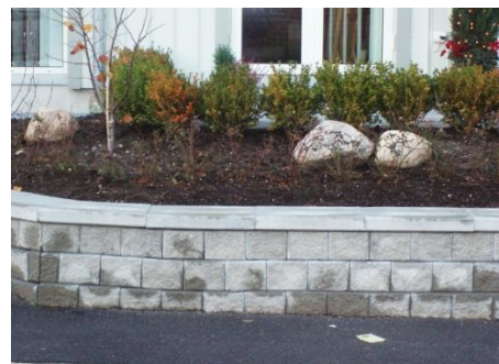
Exempel på mur