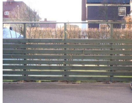
Exempel på plank

Vid ansökan om bygglov för mur och plank gör byggnadsnämnden en granskning där både placering, material och höjd är avgörande. Stor hänsyn tas till stads- eller landskapsbilden och till natur- och kulturvärdena på platsen. Det som bedöms uppfylla god bebyggd miljö kan variera mycket beroende på var i kommunen ansökan gäller. Inom område med detaljplan kan det vara mark som är prickad och inte ska bebyggas.