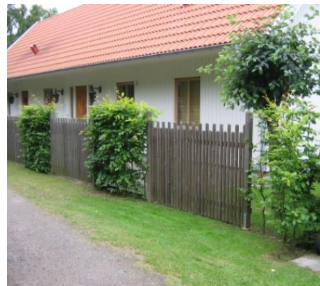
Exempel på staket