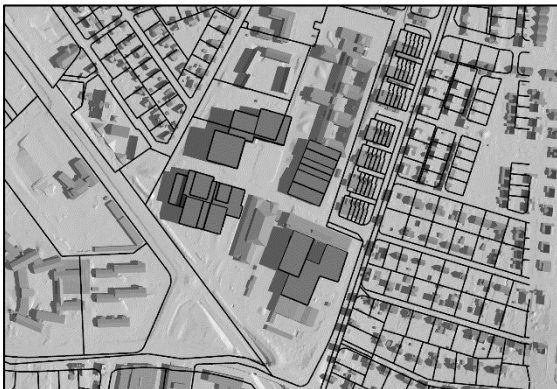
20 juni kl.09.00, sommartid