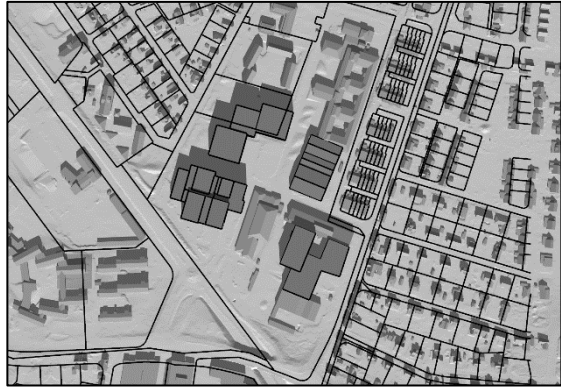
20 mars kl.12.00, vintertid