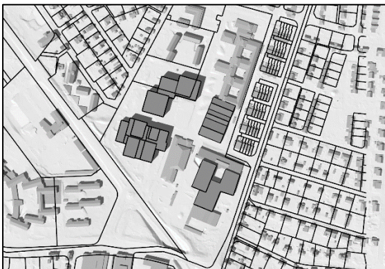
20 juni kl.15.00, sommartid