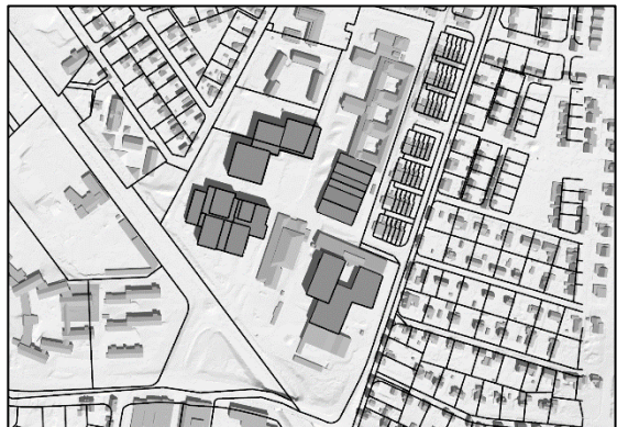
20 juni kl.12.00, sommartid