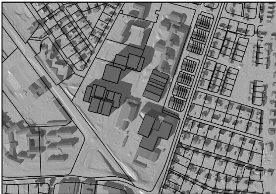
20 mars kl.15.00, vintertid