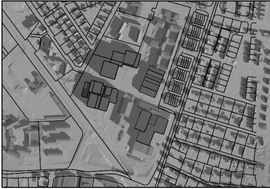
20 mars kl.09.00, vintertid