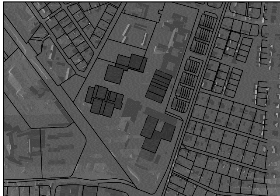
20 mars kl.18.00, vintertid