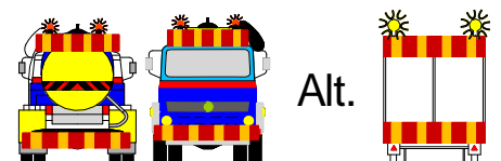
Tillägg till TA-plan enligt

Fordonens ordinarie varningslyktor (roterande) kan ersätta högt placerade lyktor, placerade ovanför X2.